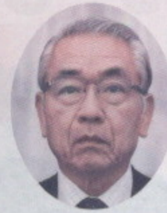
金沢市町会連合会